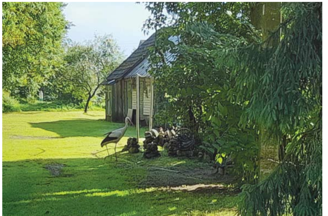
Gandras ateina dešros skanauti.

„Na, žavingame miestelyje, kur daug kūrybiškumo, bendrystės aura, dar ir gandrams yra labai gera. Ne vengia gandro kaimynystės (juk kiti peikia, kad jie neva nemažai teršia, kažko prineša ir pan.), o džiaugiasi, skiria pinigėlių „šlapiankai“, – pamanėme mudvi su