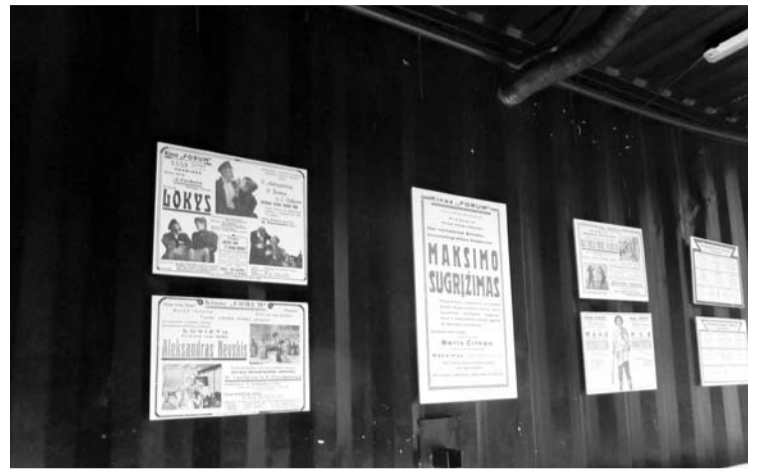
Konteineryje – tarsi mažoji paroda.

Neprabėgus nei metams, įsigalėjo sovietų valdžia, tad ra-