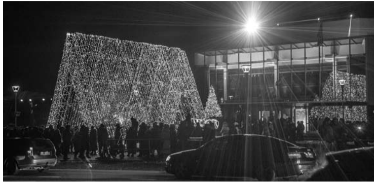
Per praėjusias Kalėdas šventinė kompozicija, pastatyta šalia Anykščių kultūros centro, žmonių buvo įvertinta skirtingai – vieni iš jos juokėsi, kitiems – patiko.

„Kodėl dešimtis tūkstančių moka už papuošimus, o išaugintą eglę prašo padovanoti. Net į bio-