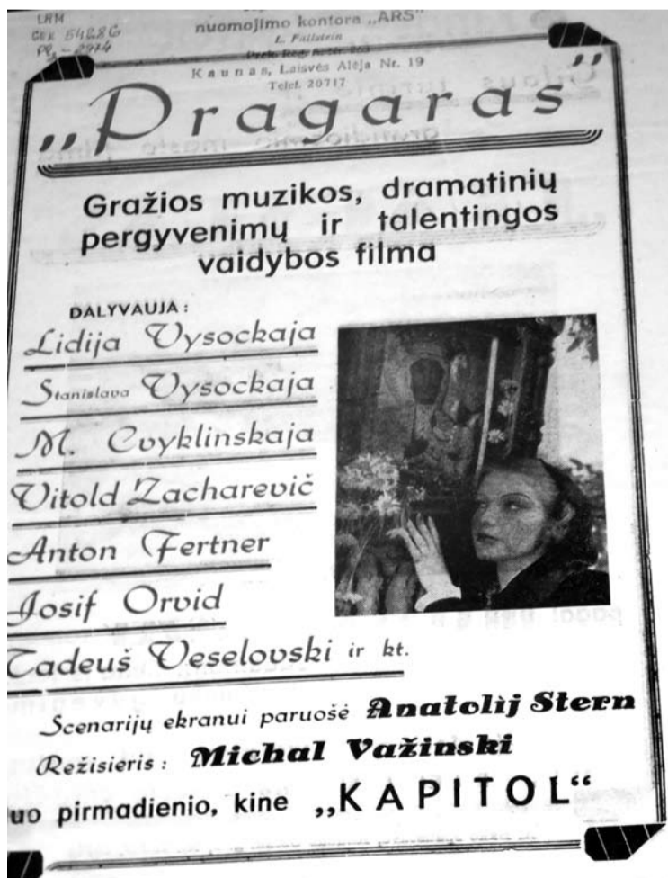
Sovietinio filmo reklama.

Kino konteineris Anykščiuose filmus suks iki pat rugpjūčio 21 dienos, tad kas dar nebuvo, nepažiūrėję, neapžiūrėję, būtinai užsukite.